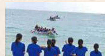
ハーレー体験の様子