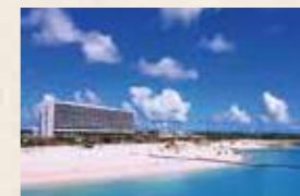
美々ビーチいとまん