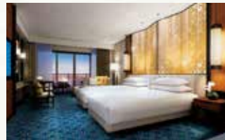
客室(プレミアムツイン)