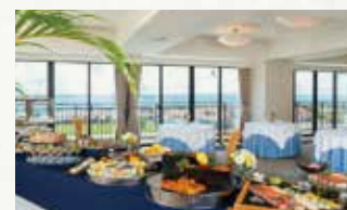
テーブルセッティング